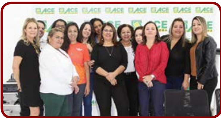
Reunião do Núcleo de Mulheres Empreendedoras da ACE Diadema