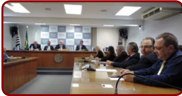
Reunião do Conselho Diretor da FACESP