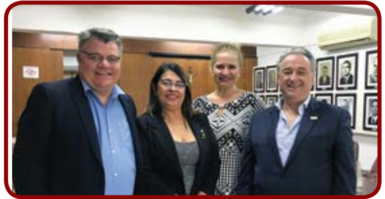
Reunião da FACESP com ACISCS