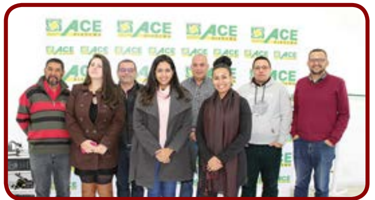
Reunião do Núcleo de Contadores da ACE e representantes da Secretaria de Desenvolvimento Econômico de Diadema