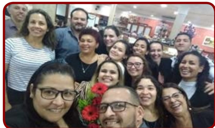
Confraternização da equipe da ACE Diadema na Churrascaria Boiadeiro Grill