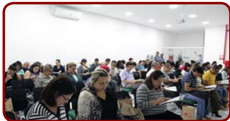
Auditório cheio na palestra Fluxo de Caixa, realizada pelo SEBRAE