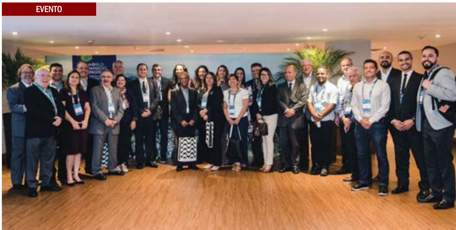
Comitiva das associações comerciais do estado de São Paulo, em parceria com a FACESP e SEBRAE