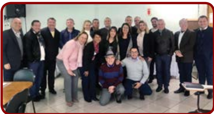
Reunião da RA2 na ACIAM - Mauá