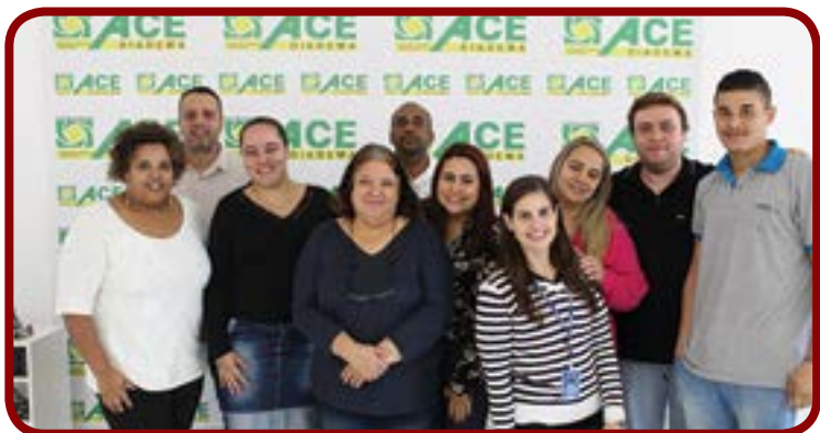
Palestra Ganhe Mercado, realizada pelo SEBRAE