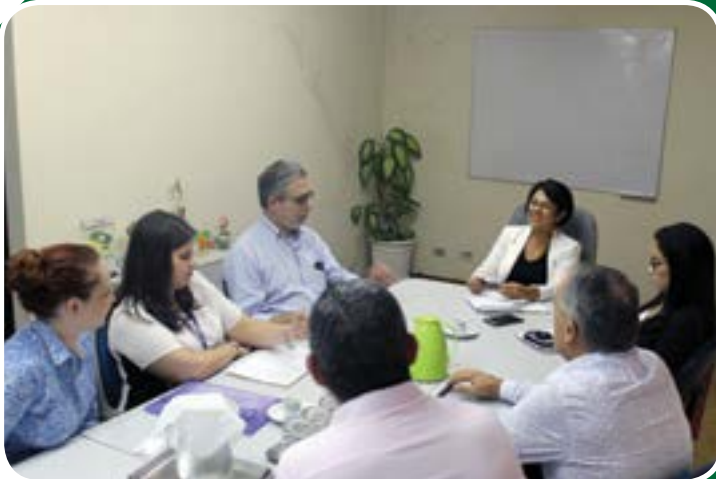
Reunião de organização do Mutirão do MEI em parceria com Caixa Econômica Federal, Sebrae SP e Secretaria de Desenv. Econômico