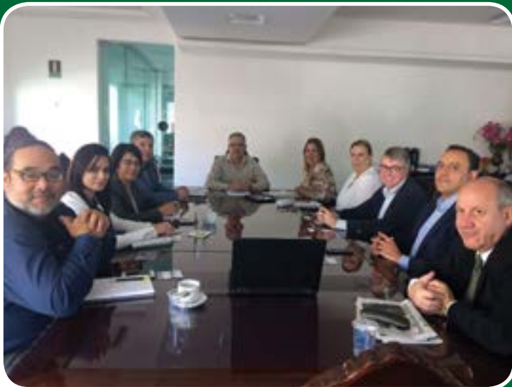
Presidentes e executivos das setes cidades do ABCD se reúnem para parceria junto a VALID