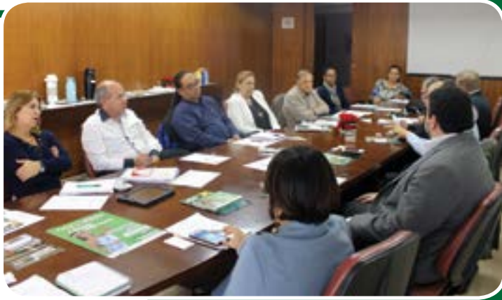
Reunião mensal dos Presidentes e executivos das sete cidades