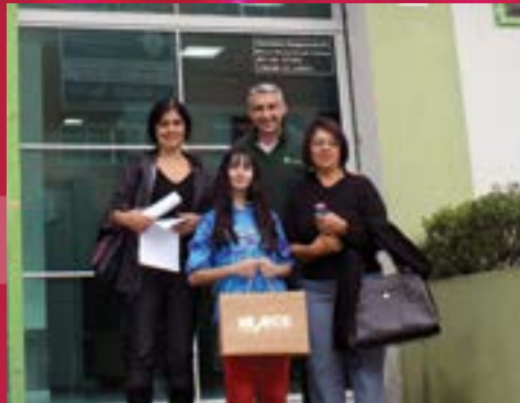
8º LUGAR: ÁGATA NOVIKOVAS ODONTO COMPANY - PULSEIRA DE OURO 18 QUILATES