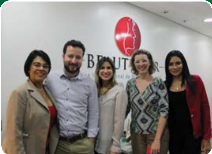
Reunião de parceria com equipe da Beauty Fair/ Ikesaki