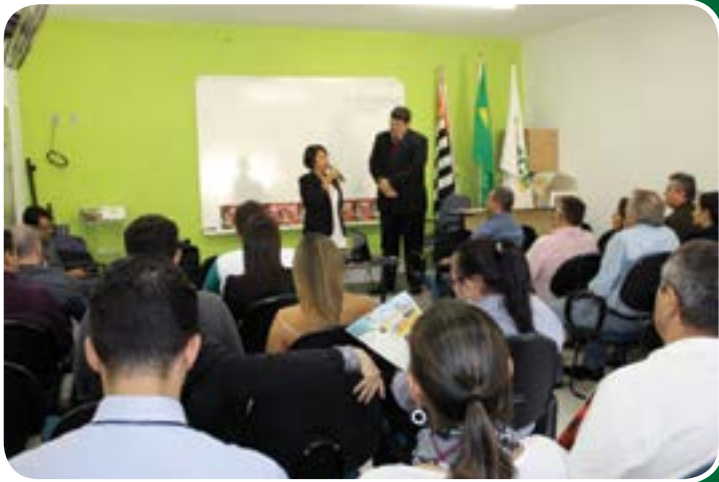
Encontro mensal do Núcleo de Negócios ACE Diadema