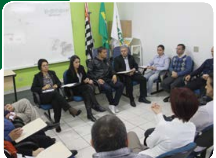
Reunião mensal com Núcleo de Contadores ACE Diadema