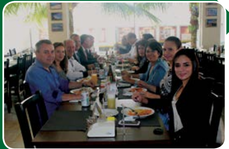
Almoço de negócios entre as 7 cidades